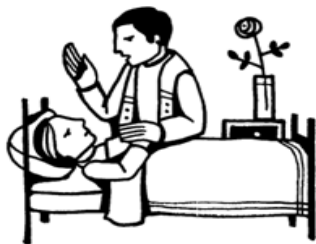
Anointing of the sick

ПРОСИМО МОЛИТИСЬ ЗА ХВОРИХ: Просимо подати імена своїх рідних або знайомих, котрі перебувають у стані хвороби та потребують нашої молитовної допомоги щодо швидшого одужання. Також пам'ятаймо у своїх молитвах за тих, хто не може вийти з дому або перебуває у старечому домі чи шпиталі. Молимося за здоров'я та одужання (імена надруковані по англійськи нижче):