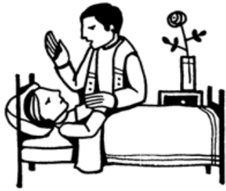
Anointing of the sick

ПРОСИМО МОЛИТИСЬ ЗА ХВОРИХ: Просимо подати імена своїх рідних або знайомих, котрі перебувають у стані хвороби та потребують нашої молитовної допомоги щодо швидшого одужання. Також пам'ятаймо у своїх молитвах за тих, хто не може вийти з дому або перебуває у старечому домі чи шпиталі. Молимося за здоров'я та одужання (імена надруковані по англійськи нижче):