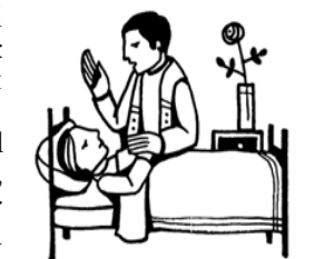
Anointing of the sick