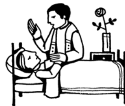
Anointing of the sick