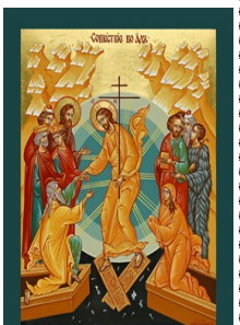
Christ Our Pascha CATECHISM OF THE UKRAINIAN CATHOLIC CHURCH