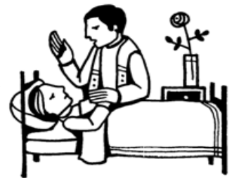
Anointing of the sick